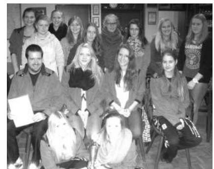
Die mit dem Pokal für sportliche Leistungen geehrte B-Mädchen-Fußballmannschaft war fast vollzählig zur Pokalübergabe erschienen.