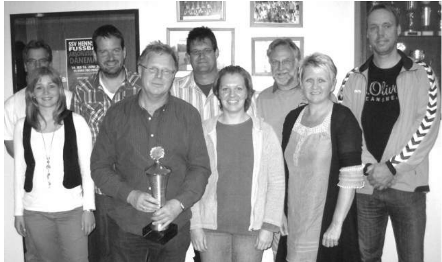
Fußball-Jugendtrainer auf der Trainersitzung