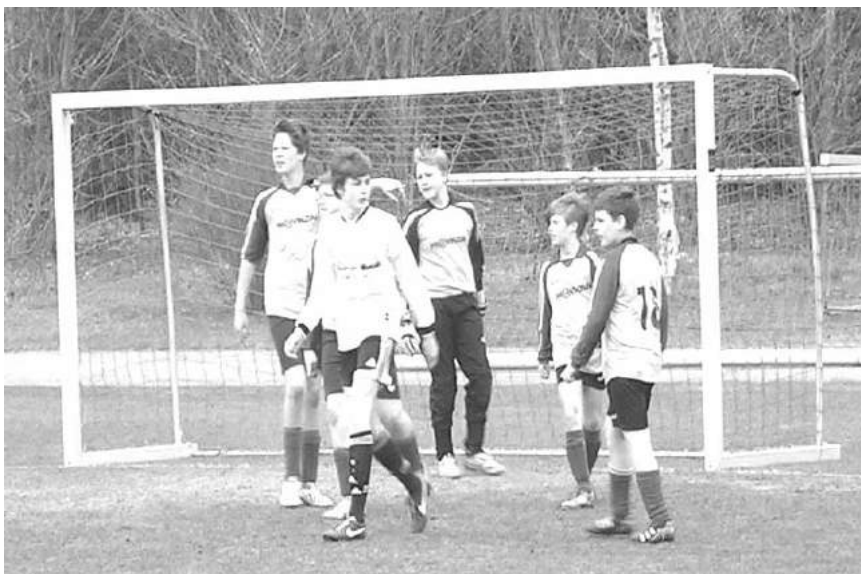
Ganz wichtig: die Abwehr wird eingestellt.