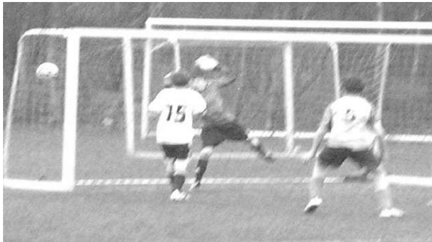
...und der Ball zappelt im Netz! 1:1!